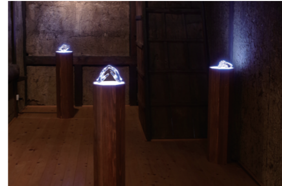
おやまのつくりかた