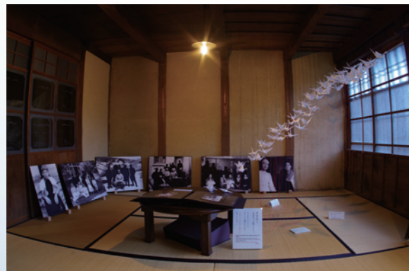
「継承」シリーズより「Memories」、 「Leftovers' War」そして「祈り」